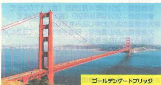
ゴールデンゲートブリッジ