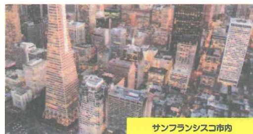
サンフランシスコ市内